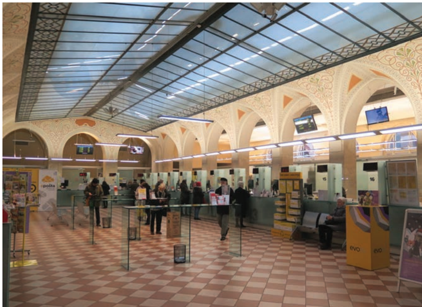
Pogled na interijer poslovnice HP u Jurišičevoji ulici

cija. Tako je 1929. ukinuto Ministarstvo pošta i telegrafa pa je PTT promet stavljen pod upravu Ministarstva građevinarstva, od 1930. do 1935. bio je pod upravom Ministarstva prometa, a 1935. ponovno je uspostavljeno Ministarstvo pošta, telegrafa i telefona. Po završetku Drugog svjetskog rata Direkcija PTT-a u Hrvatskoj funkcionirala je u sklopu Zajednice jugoslavenskog PTT-a (JPTT).