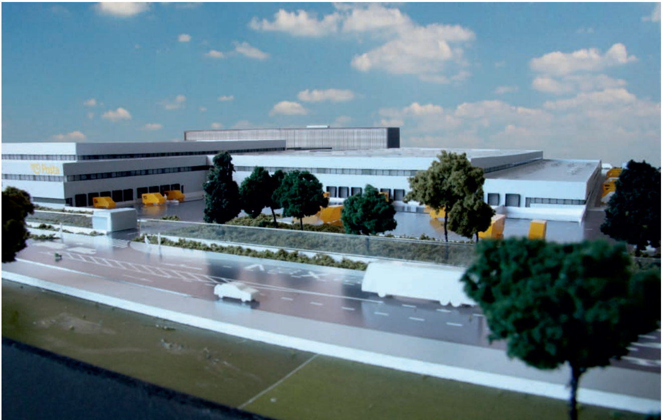
U drugoj fazi gradnje izgraditi će se zgrada Uprave HP-a

građevinski povezanu cjelinu, osim trafostanice i ulaza za dostavna vozila.