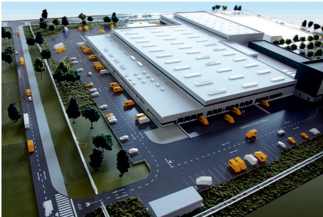
Pogled na maketu novog sortirnog centra HP-a

potom zapušteno zemljište u Gradićima kraj Velike Gorice, uskoro će postati nova adresa Hrvatske pošte . Dio zaposlenika Uprave, administracija, kamioni i sva poštanska vozila danas koji su smješteni u Branimirovoj, Jurišićevoj i Harambašićevoj ulici u Zagrebu do sredine 2019. bit će preseljeni na novu adresu, tik uz ulaz u šesti po veličini grad Hrvatske i u neposrednoj blizini Zračne luke.