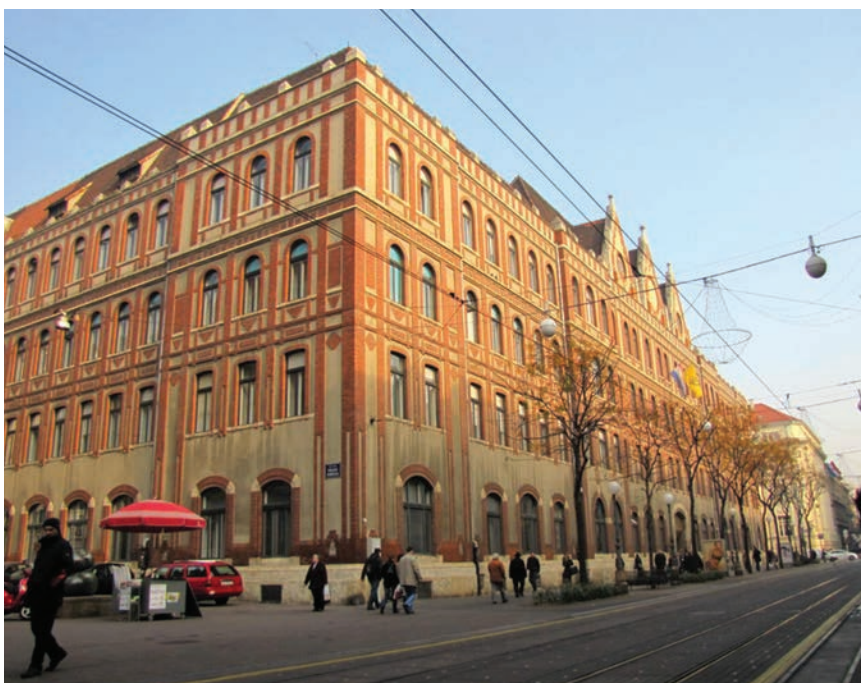
Poštanski ured i upravna zgrada Hrvatske pošte u Zagrebu

Unutar te složene transportne organizacije promet je tekao između stanica smještenih na udaljenosti od otprilike pola dana hoda. Stanice su se nazivale "statione spositae", iz čega je poslije nastala riječ "pošta". Održavanje cursus publicusa bilo je težak teret za stanovništvo jer je trebalo omogućiti besplatna kola te hranu za putnike i životinje, a trebalo je i održavati ceste te graditi postaje za odmor. U 19. st. moderna organizacija pošte uređuje se zakonima, pošiljke se distribuiraju iz poštanskih središta, veliki poštanski sustav zapošljava mnogobrojne radnike, u poslovanje se uključuje moderna mehanizacija, a pošiljke se prevoze suvremenim prijevoznim sredstvima. Odlukom bana Jelačića i Banskog vijeća 11. kolovoza 1848. u Hrvatskoj je osnovana prva nacionalna poštanska uprava sa sjedištem u Zagrebu pod nazivom Vrhovno Hrvatsko-slavonsko upraviteljstvo pošta . U travnju 1919. s radom počinje Ministarstvo pošta i telegrafa Kraljevine SHS u Beogradu, a državni teritorij bio je podijeljen na devet poštansko-telegrafskih direkcija. Sjedište hrvatske direkcije bilo je u Zagrebu. Do početka Drugog svjetskog rata u PTT prometu bilo je provedeno nekoliko reorganiza-