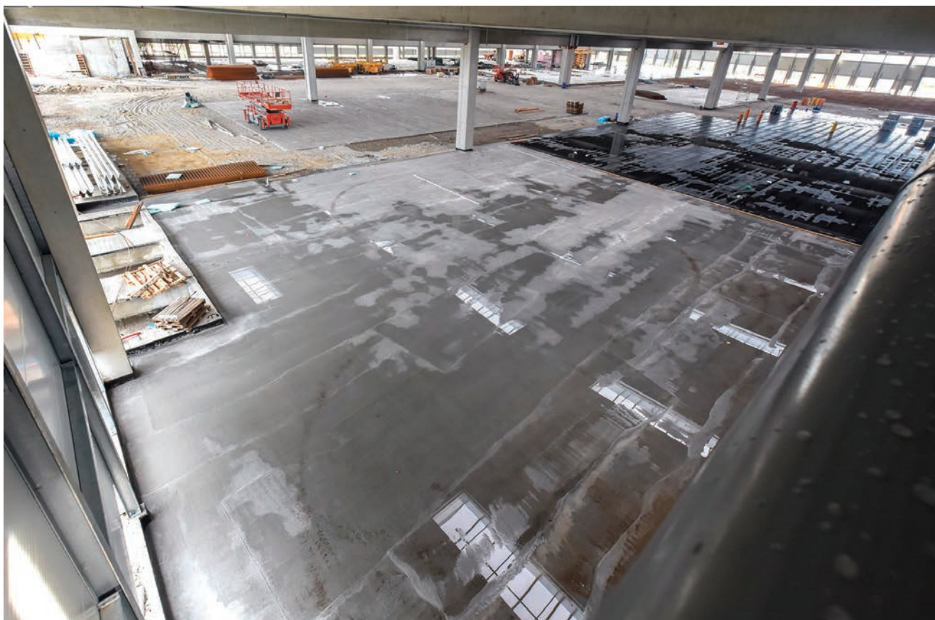
Građevinski radovi na dilataciji B

etaže za administrativno osoblje. Porta je predviđena na ulazu iz Ulice Andrije Kačića Miošića, a trafostanica s agregatom uz ulaz iz Vukomeričke ulice. Na zelenoj površini na sjeveroistočnom dijelu parcele predviđen je ukopani bazen volumena 750 m 3 s vodom za potrebe sprinkler instalacije i hidrantske mreže. Prostor za skupljanje i privremeno odlaganje otpada osiguran je na sjeveroistočnom dijelu parcele, u blizini gospodarskog dvorišta.