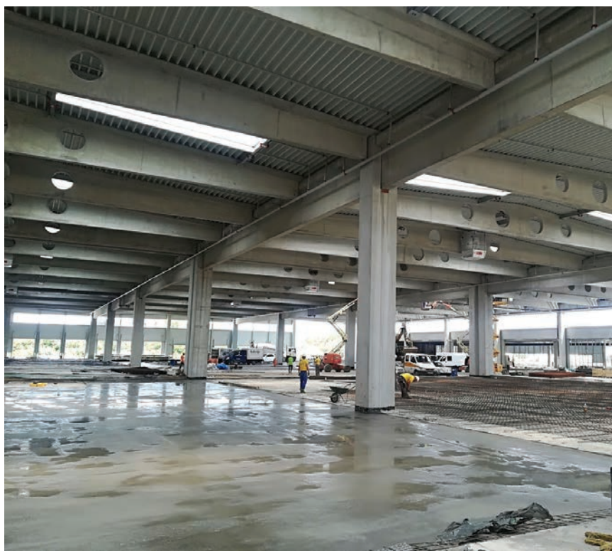
Detalj s gradilišta

Bez obzira na više funkcionalnih jedinica u sklopu projekta novoga sortirnog centra, sve građevine činit će jedinstvenu,