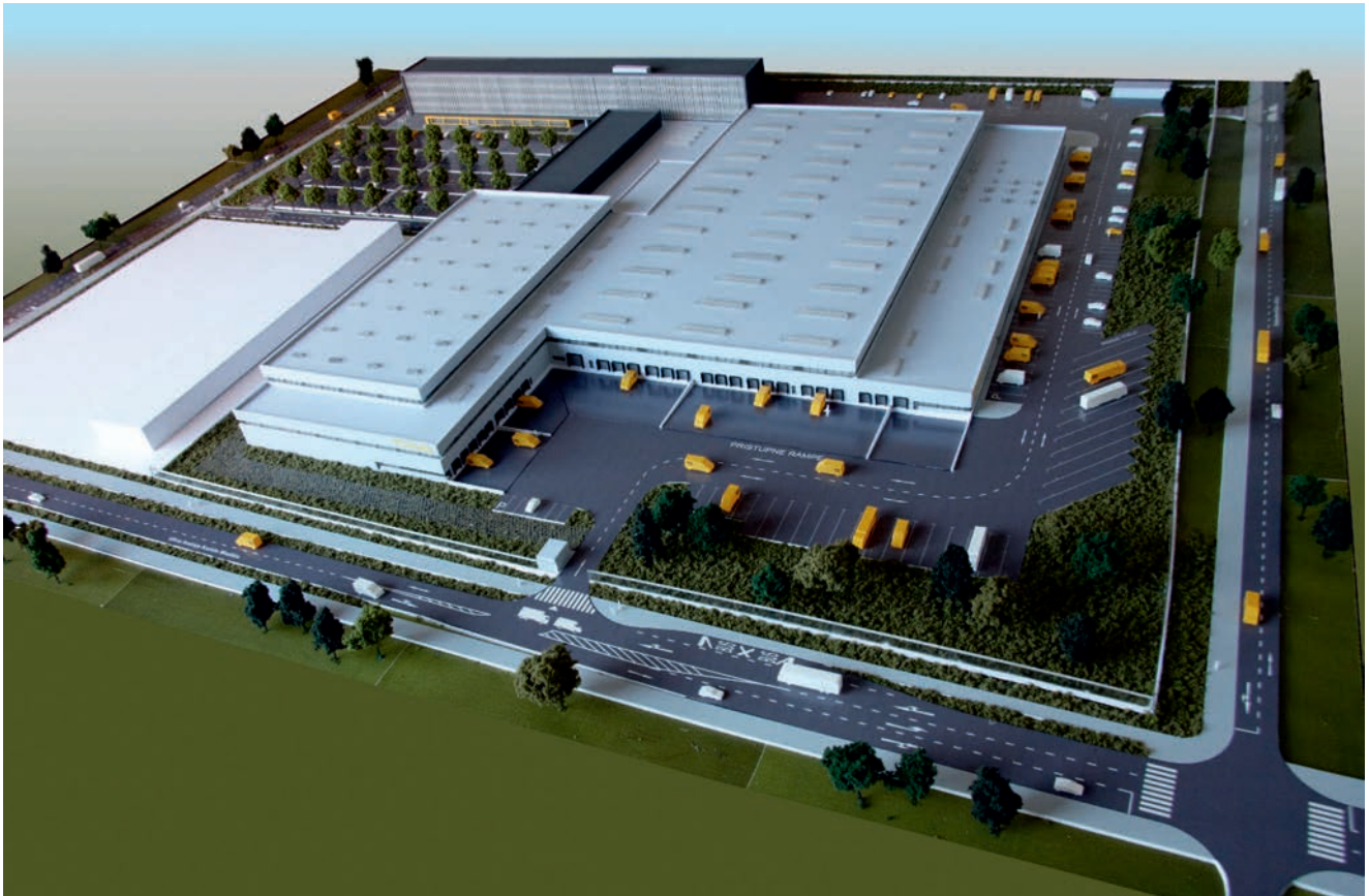
Vizualizacija sortirnog centra, pogled iz Ulice Andrije Kačića Miošića