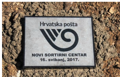
Postavljanjem kamena temeljca simbolično je označen početak gradnje centra

detaljno nam je opisao gradnju kompleksa koja je planirana u dvije faze. Ukupna površina sortirnog centra iznositi će 38.200 m 2 .