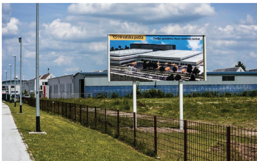
Novi sortirni centar gradi se u naselju Gradići

Naselje Gradići, osim što je blizu Međunarodne zračne luke "Franjo Tuđman", nalazi se i nedaleko od prilaza autocesti