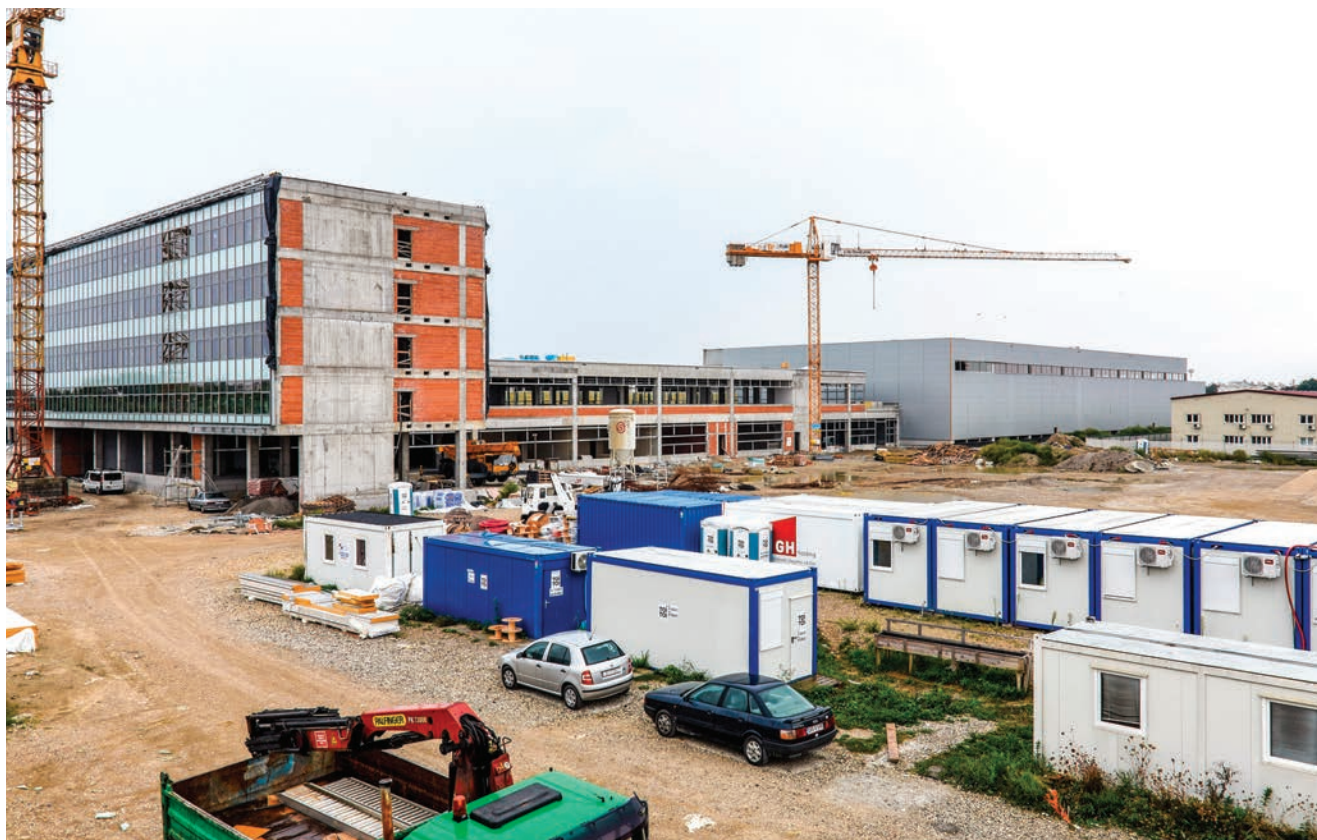
Pogled na gradilište

Iako će se s preseljenjem u Veliku Goru sliti više od tisuću zaposlenika HP-a, u Zagrebu će svi postojeći uredi namijenjeni građanima ostati na istim adresama. Preseljenjem sortirnog centra smanjit će se troškovi održavanja nekretnina jer samo za spomeničku rentu Hrvatska pošta plaća značajan godišnji iznos. Pošta se prostorija u središtu grada koje su u njezinu vlasništvu neće odreći, već će ih aktivirati u skladu sa strategijom upravljanja nekretninama. Proces projektiranja sortirnog centra započeo je 2013. kada se pristupilo izradi