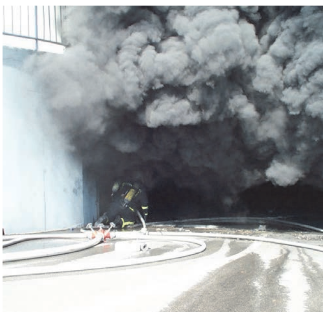
Velika količina dima onemogućuje spašavanje ljudi i imovine

Rizik gubitka ljudi i vrijednosti uvijek postoji, no najvažnije je odrediti koliko on iznosi. Strukturni dizajn zaštite od požara važan je za sigurnost i gospodarsko poslovanje građevina. Iz svega proizlazi da prilikom projektiranja nije dovoljno odrediti mjere zaštite od požara, nego je, uz već poznate smjernice ili modele, nužno razvijati i primjenu modela i proračuna za svaku građevinu zasebno.