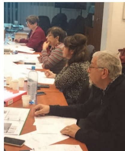
Polaznici radionice numeričke analize požarne ugroženosti

Upotreba numeričke analize požarne ugroženosti prihvatljivija je od bilo kojeg drugog propisa.