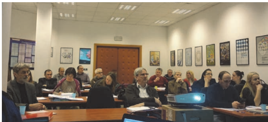
Profesionalna usavršavanja u području zaštite od požara u graditeljstvu redovito pobuđuju velik interes investitora i projektanata

Dodatne su mjere već opisane u Pravilniku. Arhitekti će ih najčešće primijeniti sve, kako bi se osjećali sigurnima. Međutim, takva praksa ne ide u prilog investitorima koji, kada bi znali da je sigurnost građevine moguće postići uz mnogo niže izdatke, zasigurno ne bi prihvaćali takve prijedloge. Dodatne mjere zaštite od požara nisu jednokratni trošak. Najčešće tijekom trajanja dodatnih mjera (automatski sustavi za dojavu požara, automatski sustavi za gašenje požara, hidrantske mreže, vatrogasni aparati, javljači požara, vatrodiojavne