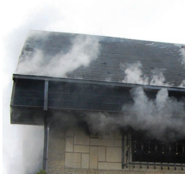
Požar potkrovlja stambene zgrade