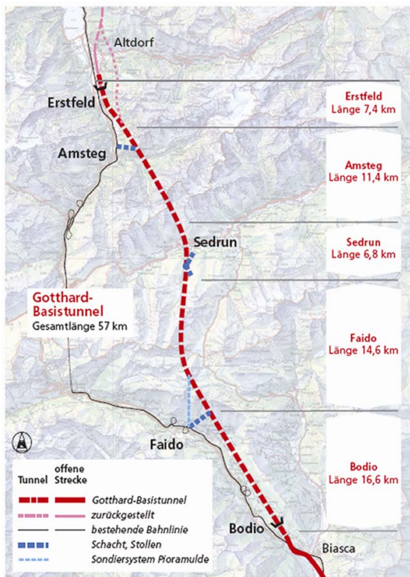
Položaj tunela u Alpama

Vlakovi će kroz gorje voziti na nadmorskoj visini od 500 metara, umjesto da se kao do sada mukotrpno probijaju na nadmorskoj visini od 1000 metara pri čemu su se morale mijenjati lokomotive. Putovanje od Züricha do Milana i obratno trajat će jedan sat manje, a od Züricha do Lugana sat i četrdeset minuta manje. Prije svega rasteretit će se cestovni robni prijevoz preko Alpa. Tunelske cijevi bušile su se od 1996. istodobno na pet mjesta, nakon što su švicarski birači referendumom 1992. prihvatili projekt tvrtke AlpTransit Gotthard AG . Procijenjeni ukupni troškovi veći su od deset milijardi eura.