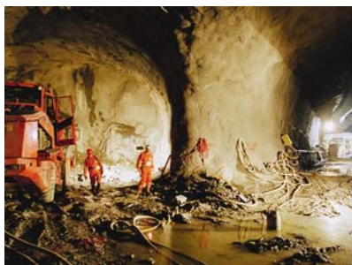
Dio labirinta tunela

Grubo izbušene cijevi ispod divovskog gorskog masiva nisu pristupačne u cijelosti. Stijene su učvršćene prskajućim betonom, na tlu ima napretek prašine i mulja. Sustav višestruko funkcionalnog središta Sedrun je zamršen, pravi labirint glavnih i sporednih tunelskih cijevi ukupno dugih 151,84 km. Između istočne i zapadne glavne cijevi razmak je 40 metara. Kolosijeci su položeni privremeno, ponajprije za radne vlakove i betonske miješalice. Jedan dio iskopane kamene mase prerađuje se na licu mjesta u gradivo.