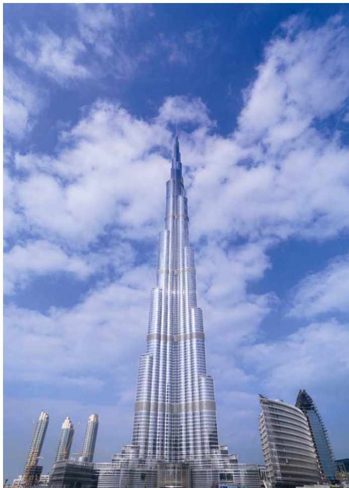
Silueta staklenih površina u Dubaju u budućnosti bi mogla biti promijenjena

nekoliko godina, s brojnim staklenim skulpturama, zgradama kao što su Burj Halifa, Dubai Pearl ili Pentominium, koje su neosporno promijenile siluetu grada.