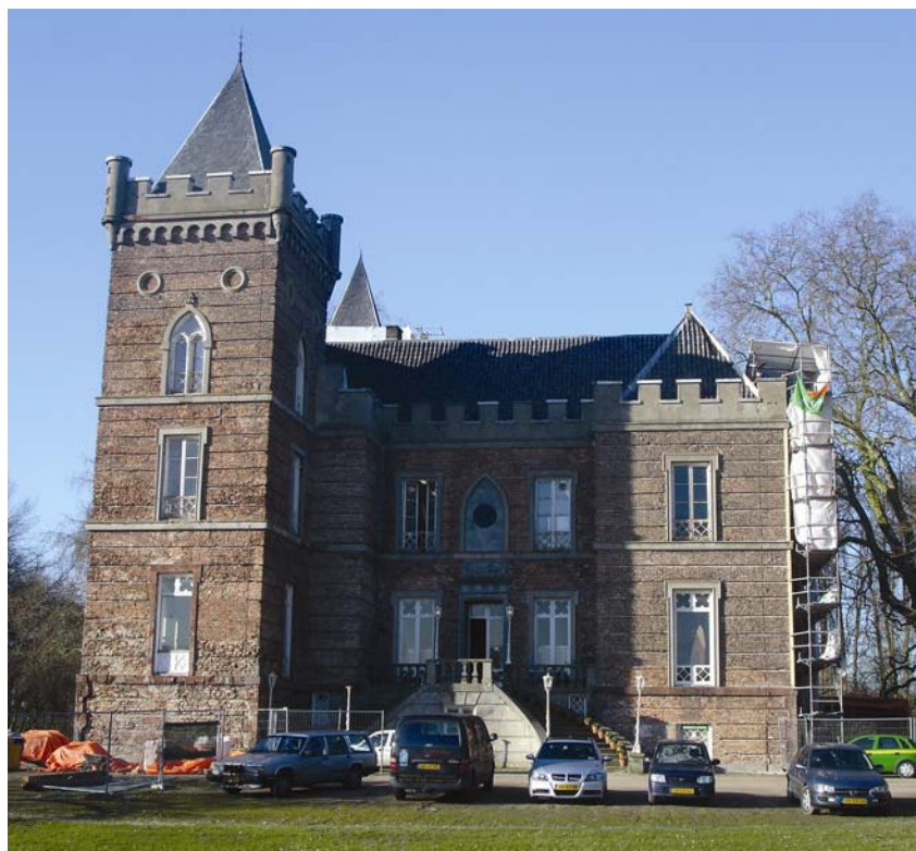
Sanirani dvorac Beverweerd