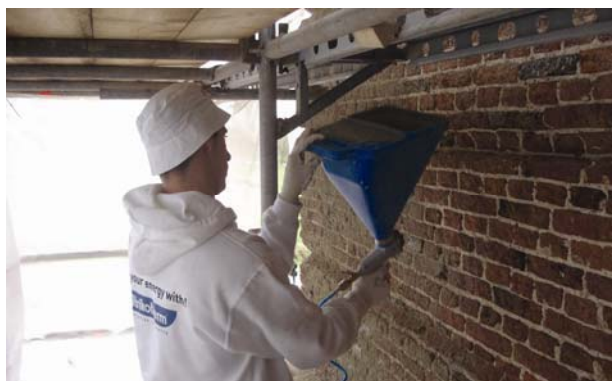
Nanošenje prvoga sloja Exzellenta na očišćeni zid od opeke

jesnih građevina. Zahvaljujući specijalnim aditivima i jedinstvenoj geometriji pora, žbuka je iznimno propusne građe. Geometrija pora udružena s visokim sadržajem vapna u ovoj nehidrofbnoj žbuci dopušta do 15 puta viša svojstva ishlapljivanja u usporedbi s uobičajenim žbukama za restauraciju.