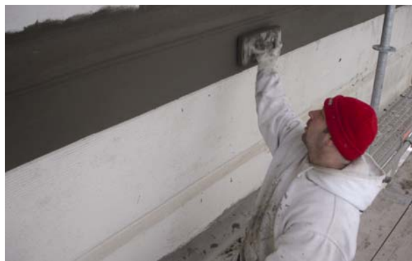
Nanošenje završnih slojeva nove žbuke

otpornost, čvrstoća postojana, a ima i nisku razinu skupljanja. Mala težina dopušta nanošenje u tankom sloju. Sve konstrukcijske, fizikalne i tehničke karakteristike primjene