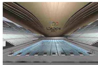
Slika 6. Pogled na plivalište iznutra

Bez obzira na ishod kandidature Londona za organizaciju olimpijskih igara, zatvoreno plivalište koje će moći primiti 20000 gledatelja u svakom će slučaju biti izgrađeno na lokaciji predviđenoj za olimpijski kompleks u Stratfordu (East London). Usporedo s gradnjom olimpijske dvorane za plivanje, koja će svojim krovom oblika slova S postati obilježje kompletnog područja, planira se revitalizacija 1,8 kvadratnih kilometara velikog područja u Stratfordu. Neobičan oblik krova potječe od pokreta (toka) vode karakterističnog za športove kojima je građevina namijenjena i od lokacije gradnje koja se nalazi na obali Temze.