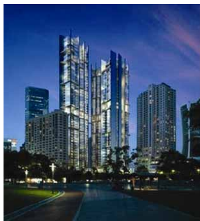
Pogled na tri nebodera The Troika

Za razliku od Pellijevih tornjeva oblikovanih upotrebom elemenata stare malezijske umjetnosti građenja, Foster je nove građevine oblikovao striktno na principima suvremene arhitekture. U izgledu potpuno ostakljenih pročelja tornjeva oslikava se struktura unutarnje nosive konstrukcije.