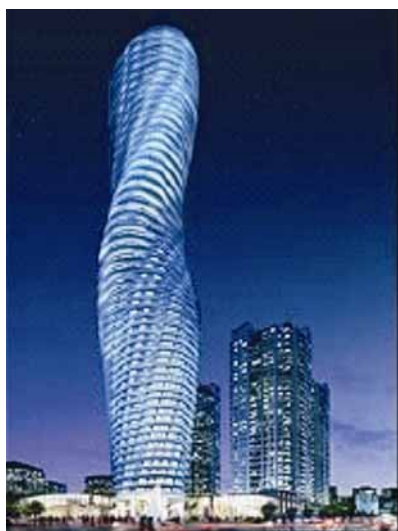
Neboder Marilyn Monroe noću

Da jedan kineski arhitektonski biro gradi nebodere u Sjevernoj Americi izuzetno je rijetko. Pekinški je biro MAD osvojio prvu nagradu na natječaju za neboder u Mississaugi kod Toronta i time možda otvorio i drugi smjer komunikacije između arhitekture Kine i Sjeverne Amerike.