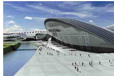
Pogled na ulaz plivališta

izgradnju olimpijskog centra športova na vodi. Ocjenjivački sud kome je predsjedavao Richard Rogers (London) odlučio je prvu nagradu, a time i izvedbu građevine, dati londonskoj arhitektici Zahi Hadid.