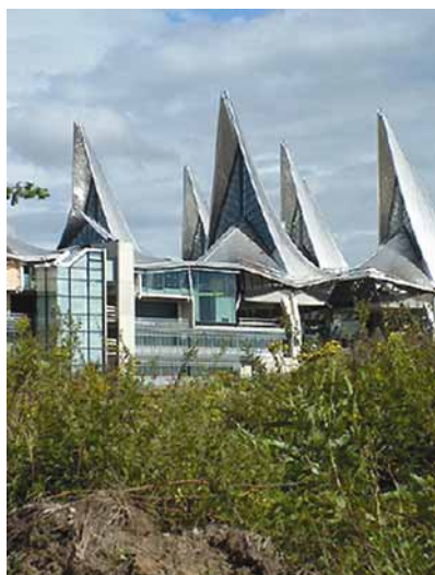
Ulaz u palaču pravde

Građevina čija je izgradnja investitore stajala 250 milijuna eura koncipirana je poput novih gradskih vrata i kao veza između grada i rijeke Shelde.