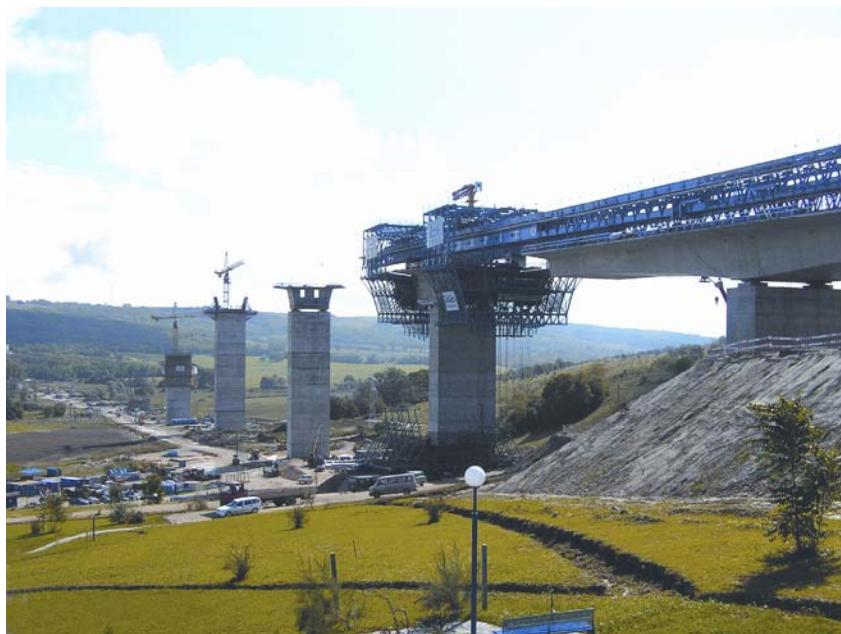
Slika 1. Gradilište vijadukta Köröshegy

Na južnoj obali Blatnog jezera u Mađarskoj, u Köröshegyu gradi se najduži kopneni most u srednjoj Europi. Most je dio produžene autoceste M7 koja vodi do hrvatske granice. Nosiva konstrukcija vijadukta s ukupnom dužinom od 1.872 m oslanja se na 16 stupova visine do 80 m. Oni se oplakuju Doka-penjajućim sustavom GCS. Izvođač radova je Hídépítő Rt. Gornja konstrukcija izvodi se s pomoću složenih oplatnih kolica oslonjenih na uređaj za naguravanje.