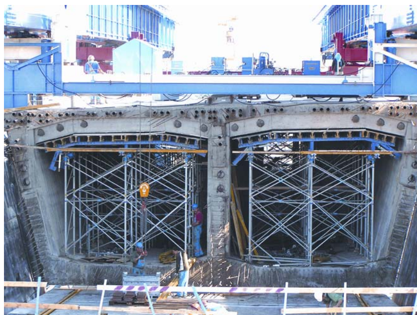
Slika 5. Izvođenje gornje konstrukcije vijadukta

dužina od 120 m betonira se u segmentima s obje strane doline s dvojitom složenim oplatnim kolicima oslonjenima na uređaje za naguravanje poduzeća PeinigerRöRo . Svaki uređaj za naguravanje sastoji se od dvojitih oplatnih kolica, koja se kreću preko dva 158 m dugačka nosača uređaja za naguravanje. U 11,25 m dugačkim odsječcima betoniranja nastaje u oba pravca od "glave" po 60 m rasponske konstrukcije vijadukta.