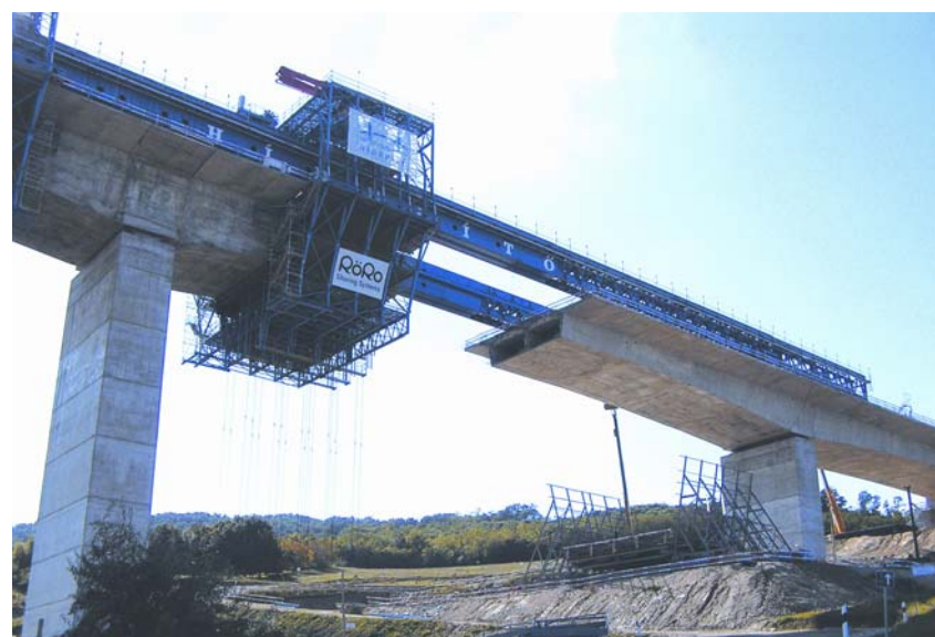
Slika 4. Izvedeni odsječak vijadukta i premještanje oplata na drugi stup

ta. Čim je raspon vijadukta sa zadnje strane zatvoren i s prednje strane gotova polovica raspona između dvaju stupova, oba nosača uređaja za naguravanje pomiču se do sljedećeg stupa. Nakon toga se oplatna kolica prevoze do novih pozicija s obje strane "glave". Da bi oplatna kolica mogla zaobići stup, njihova se donja polovica hidraulički otvara. Sada se izvodi novi segment prema gore opisanom postupku.