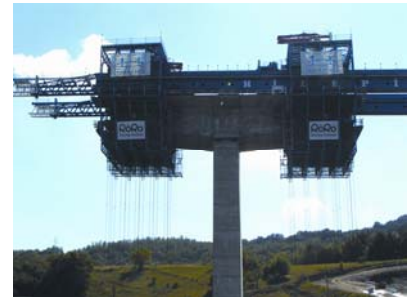
Slika 2. GCS-platforma

brzim postupkom premještanja štedi se vrijeme uporabe dizalice.