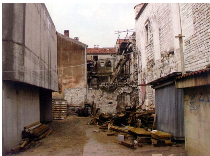
Prostor između kazališta i crkve Sv. Dominika sa starim zidom

Glavna intervencija u prvoj fazi uređenja gradilišta jest uz dogradnju postojeće zgrade izgradnja nove ulazne građevine smještene uz sjeverozapadni obodni zid postojeće zgrade. Ta će zgrada služiti kao ulaz za gledatelje iz ulice Špire Brusine, pokraj ulaza u crkvu Sv. Dominika. Zgrada je dijelom namijenjena posjetiteljima, a dijelom vježbama glumaca i druženju s publikom. U prizemlju će biti prostrani trijem te ulaz u prostorije za vježbanje scenskog pokreta što će služiti i kao pomoćna kazališna dvorana. Kako je nova zgrada potpuno odvojena od već izgrađene, gledatelji će do glavne pozornice dolaziti preko dva natkrita "mosta", a još je jedan "most" predviđen za scensko osoblje. I ova će se zgrada graditi od masivnih armiranobetonskih nosivih zidova sa stupovima te punim armiranobetonskim plo-