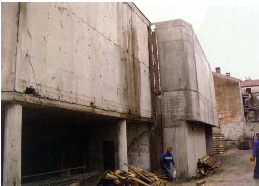
Pogled na rubni južni dio zgrade

Na kraju smo potražili i arhitekta Pavla Marušića da bismo se što bolje informirali o ovom zanimljivom i složenom gradilištu neobične sudbine. Saznali smo da je postojeća zgrada projektirana i građena za kazalište lutaka uz poštivanje svih ondašnjih normativa i propisa. Gabarite su zgrade uvjetovala odabrana tehnološka rješenja, uvjeti konzervatora i postojeće okolne zgrade. Zgrada u svom manjem dijelu ima podrum, prizemlje s pomoćnim prostorima za smještaj tehnologije scene, a tu su dijelom