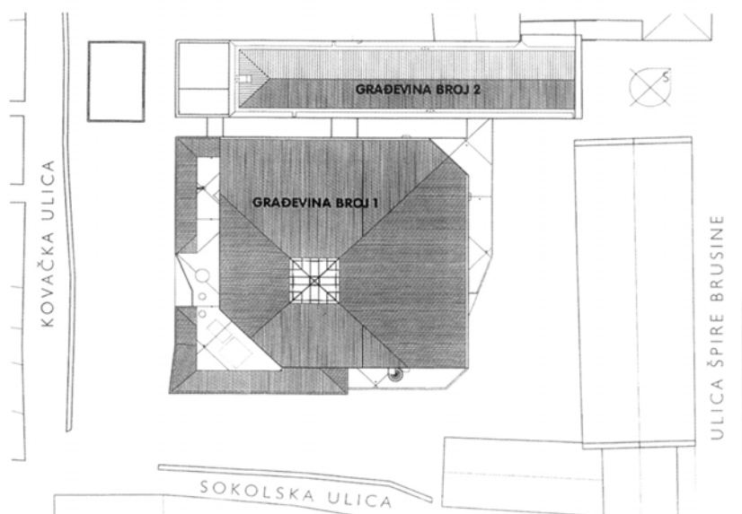
Smještaj nove zgrade kazališta u zaštićenoj povijesnoj jezgri