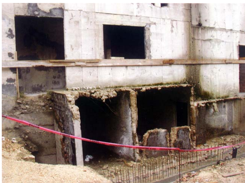
Detalji oštećenih zidova