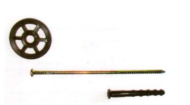
Slika 1. Elementi univerzalne stropne i fasadne pričvrsnice

Univerzalna stropna i fasadna pričvrsnica koja se upotrebljava za mehaničko pričvršćivanje lakih građevinskih ploča na fasadne zidove, unutarnje zidove i na