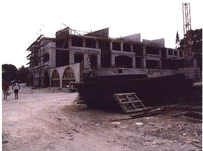
Pogled na lijevi ulazni dio

No kako se radi o vrlo zahtjevnom i složenom gradilištu utemeljen je poseban čakovečki joint venture između Teama, koji je dioničko društvo u privatnom vlasništvu, i Međimurje graditeljstva, koje je utemeljilo žu-