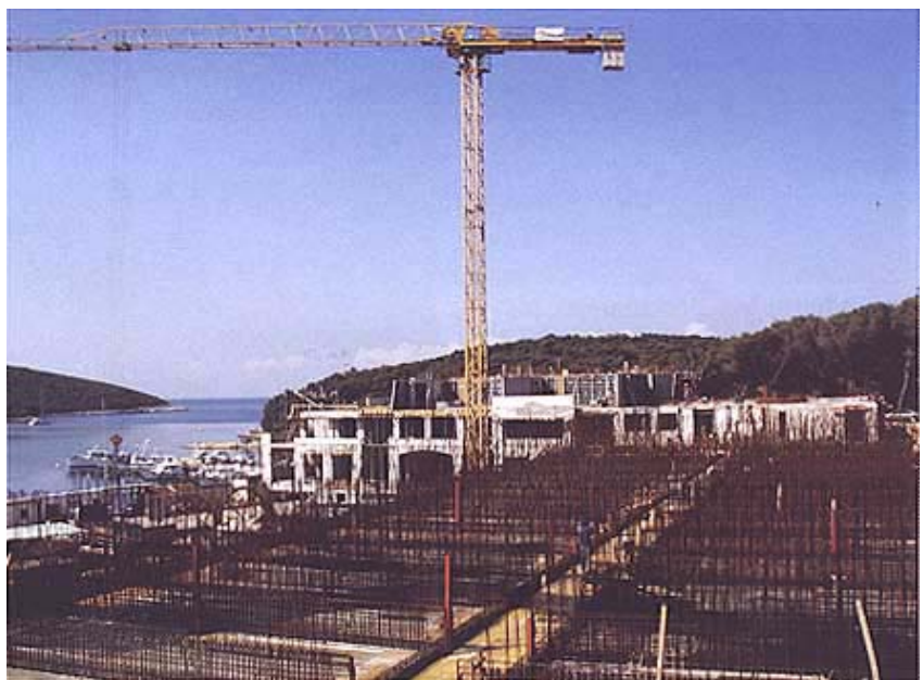
Gradilište snimljeno odozgo

indijskog mramora te građenjem stanova. Vlasnik je i nekoliko hotela u Italiji, od kojih nijedan nije na moru pa mu je ovo prvo takvo iskustvo.