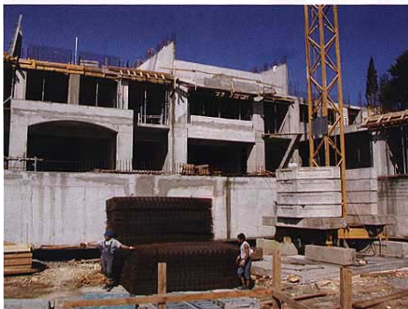
Detalji gradilišta u dvorišnom dijelu kompleksa

da iz poticane stanogradnje. U sadašnjoj fazi se izvodi konstrukcija koja se radi kvalitetno, a cijeli je projekt pod pojačanim nadzorom stručnjaka iz općine Medulin koji do sada nisu imali nikakve primjedbe. Saznali smo da kvalitetu ugrađenih materijala ispituje IGH-ov Laboratorij iz Varaždina, s kojim međimurski građevinari maju poseban sporazum. Oni dolaze povremeno na gradilište.