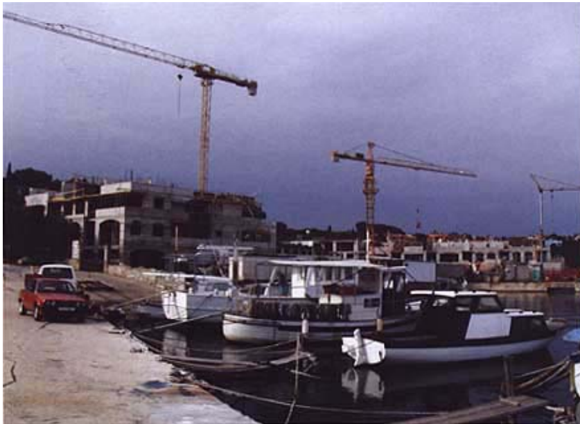
Dio gata s gradilištem u pozadini

lacijski plan odredio za Volme (brdo s druge strane zaljeva) i porto Paltana prenamjenu u turističke sadržaje, koji uključuju i gradnju hotela. A marina se u imenu spominje stoga što je županijski plan i predvidio gradnju marine u ovoj uvali. No tome se lokalno stanovništvo snažno protivi i dvojbe će se razjasniti u detaljnom planu općine Medulin. Čini se da će u ovoj zaštićenoj uvali biti samo sportsko privezište s pedesetak vezova.